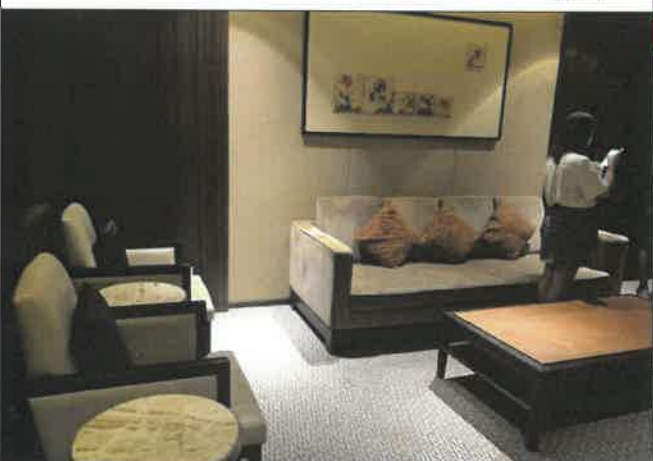
난징 진링호텔 귀빈 대기실 점검