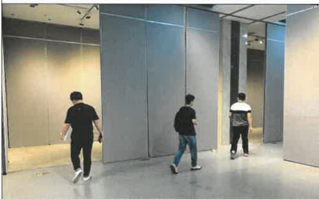
난징 도서관 전시장 도면 작성 및 현장실측