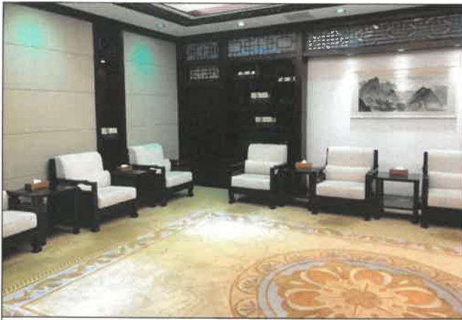
난징 도서관 귀빈 대기실 점검