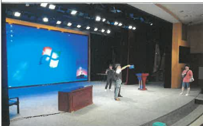
난징 도서관 무대 제반시설 점검 및 실측