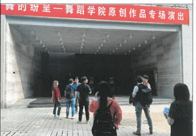
난징 예술대학교 내빈 입장동선 점검