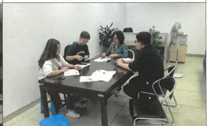
난징 도서관 시설 담당자 업무협의