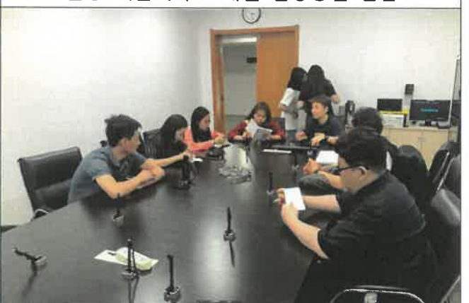
난징 예술대학교 시설 담당자 업무협의