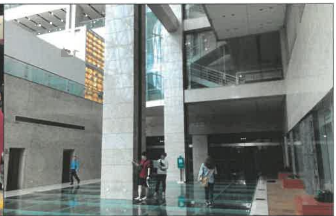
난징 도서관 로비 홍보물 거치장소 실측