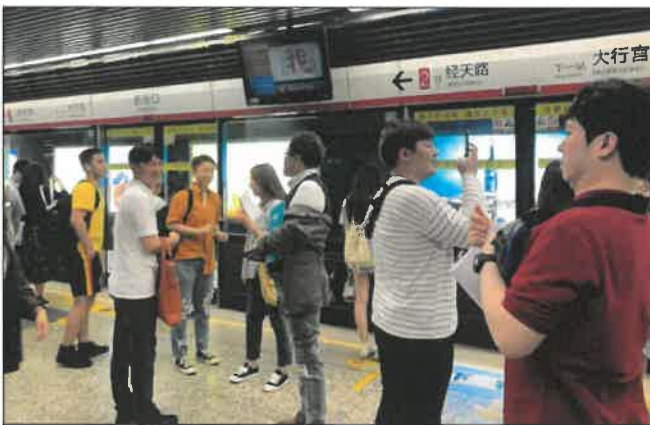
난징 도서관 지하철