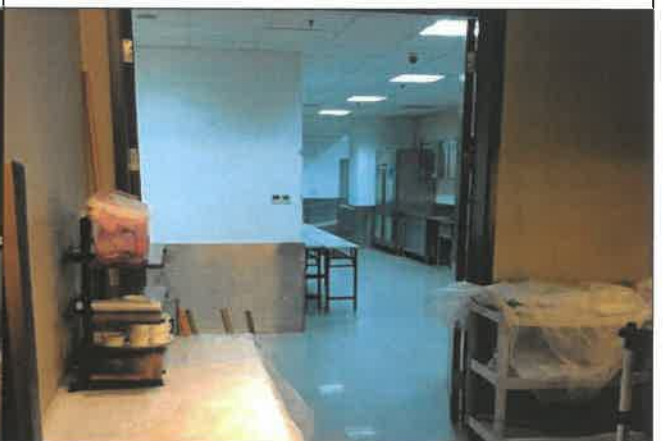
난징 진링호텔 연회장·조리실 동선 점검