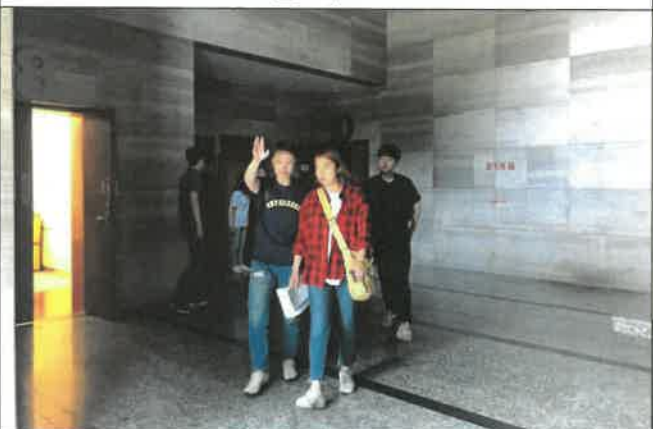
난징 예술대학교 VIP 동선 및 제반사항 점검