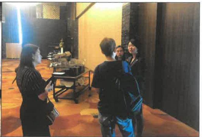
난징 진링호텔 시설 담당자 업무협의