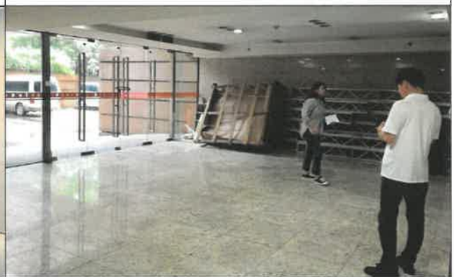
난징 도서관 전시장 물품 반입로 점검 및 실측